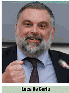
Luca De Carlo

La birra italiana dice addio alle norme del 1970 con il via libera alla riforma del settore. Una svolta storica arrivata il 4 marzo 2026, con l'approvazione definitiva in Senato della legge sulle pmi (da ultimo si veda ItaliaOggi del nove marzo 2026). Con essa l'Italia archivia ufficialmente il dpr 1498/1970, una normativa che per oltre cinquant'anni ha regolato la produzione brassicola nazionale. A dettare il cambiamento è stato l'emendamento firmato dal senatore Luca De Carlo , presidente della commissione agricoltura di Palazzo Madama, che ha aperto la strada a regole moderne, in linea con gli standard europei e l'evoluzione qualitativa del comparto. Entro 180 giorni dalla pubblicazione sulla Gazzetta Ufficiale , un decreto interministeriale definirà le nuove caratteristiche analitiche e i requisiti di qualità per le diverse tipologie di birra made in Italy. Per Unionbirrai , associazione di categoria dei piccoli birrifici indipendenti, si tratta di un risultato di grande rilievo. «È un passaggio storico», dichiara il direttore generale Vittorio Ferraris . «Finalmente si apre la strada